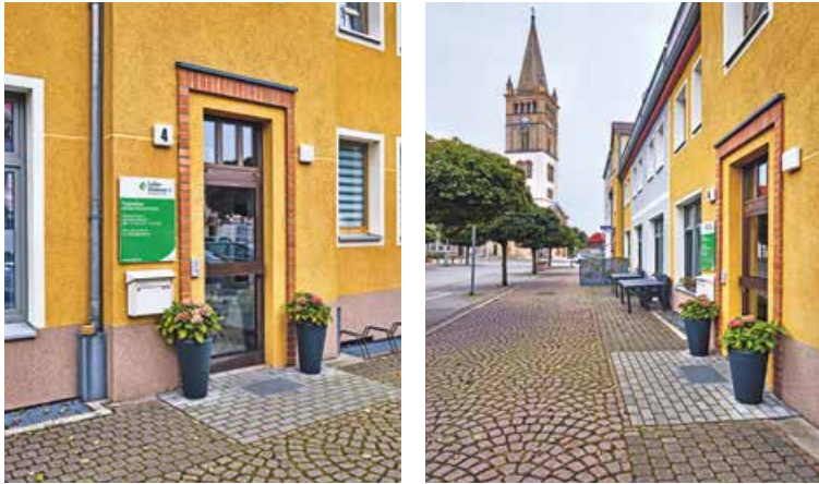
Bötzower Platz 4, 16515 Oranienburg

Die Tagespflegeeinrichtung liegt im Zentrum von Oranienburg in der Nähe des Schlosses. Die Räumlichkeiten befinden sich im Erdgeschoss und sind senio- ren- und behindertengerecht ausgestattet.