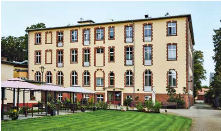
Wilhelmsdorf 21/22, 14776 Brandenburg

Das Seniorenzentrum liegt in einer großzügigen Parkanlage und verfügt über 80 vollstationäre und 5 Kurzzeitpflegeplätze. Die Wohnbereiche verteilen sich über drei Etagen. Die vertrauten Möbel der Bewohner:innen sind willkommen und sorgen für ein individuelles Wohngefühl.