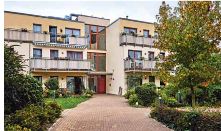
Prenzlauer Allee 1-2, 17268 Templin

Das Seniorenzentrum liegt im Herzen von Templin und verfügt über 44 voll- stationäre Pflegeplätze, 2 Kurzzeitpflegeplätze und 25 Service-Wohnungen.