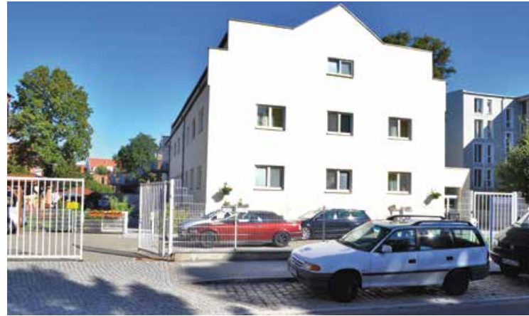
Kirchhofstraße 14, 14776 Brandenburg an der Havel

Die Wohnstätte / Besondere Wohnform für Menschen mit Beeinträchtigung befindet sich im Zentrum der Stadt Brandenburg a. d. Havel in der Kirchhofstraße 14. Auf dem Grundstück gibt es Grünfläche und einen alten Baumbestand. Das Stadtzentrum, der Bahnhof sowie der ÖPNV sind in wenigen Gehminuten erreichbar.