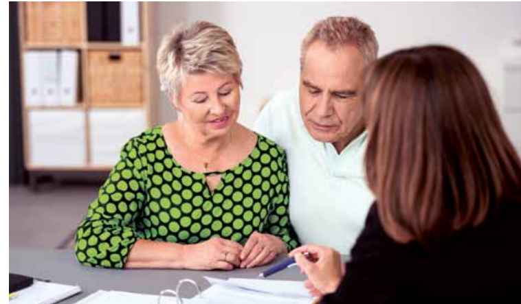
Aderluch 44 a, 16515 Oranienburg

Die Pflegeberatung offeriert Dienstleistungen zu allen Fragen rund um die Betreuung und Pflege. In individuellen Beratungen und Informationsveranstaltungen werden Hilfestellung bei Entscheidungsfindungen, aber auch Informationen über Leistungen der Pflege- und Krankenkassen, sowie deren Finanzierung angeboten.