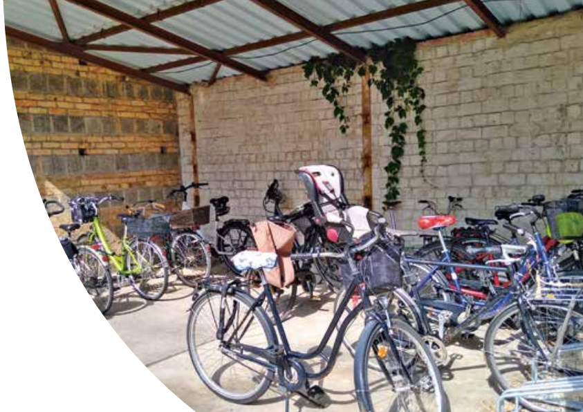
Ein ehemaliger Autostellplatz wurde zu Fahrradstellplätzen umfunktioniert

Mittlerweile haben wir fast alle gesteckten Ziele erreicht. So wurden beispielsweise ein ehemaliger Autostellplatz zu Fahrradstellplätzen umfunktioniert, energiesparende LED-Leuchtmittel in den Büros eingebaut und eine Sammelstelle für alte Handys eingerichtet. Weiterhin zeichnet die Initiative „Faire Gemeinde“ unserer Landeskirche unsere Bemühungen hin zu mehr Nachhaltigkeit aus. Lediglich die Idee des Fahrradleasings für Mitarbeitende scheitert bisher am Tarifvertrag, und auch die Umsetzung einer Fahrge-